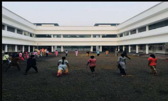
Early morning warm up sessions