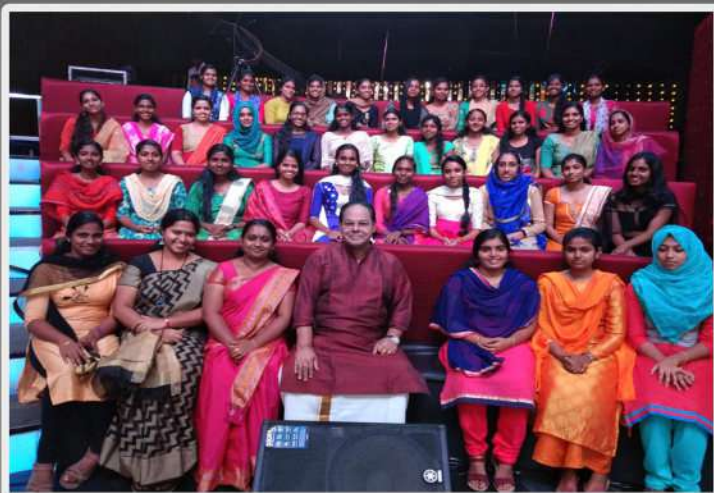
At ZEE Kerala Studio with Innocent, Former member of parliament and actor