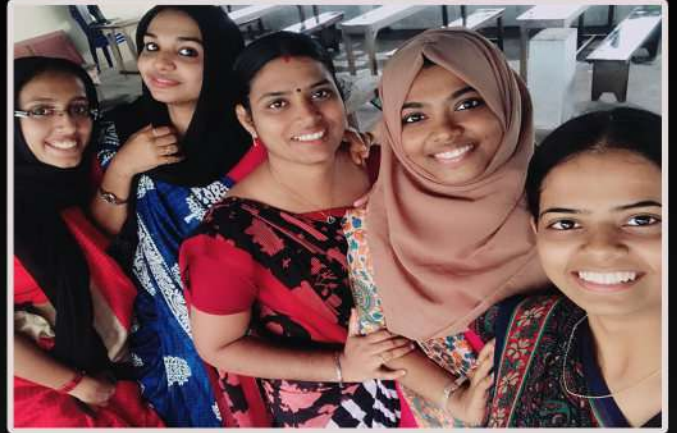
Interns at Queen Mary's E.M.H.S, Mudickal