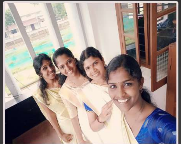
Interns St. Joseph's High School, Varapuzha