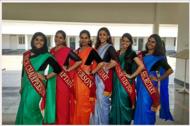
Union Members - Batch 2018-2020