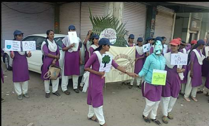
Mime presented at Thottakkattukara, Aluva