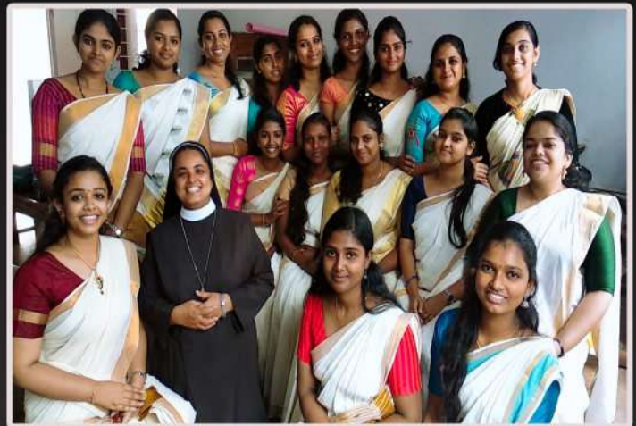
Interns at Holy Ghost Convent Girls Higher Secondary School, Aluva