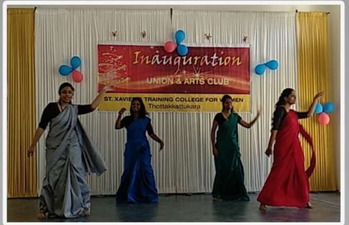
Performance by the Union Members