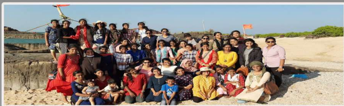
St. Mary's Island, Uduppi