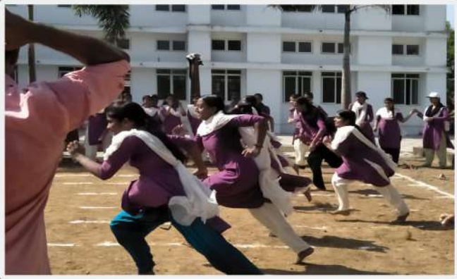
100 ms Race