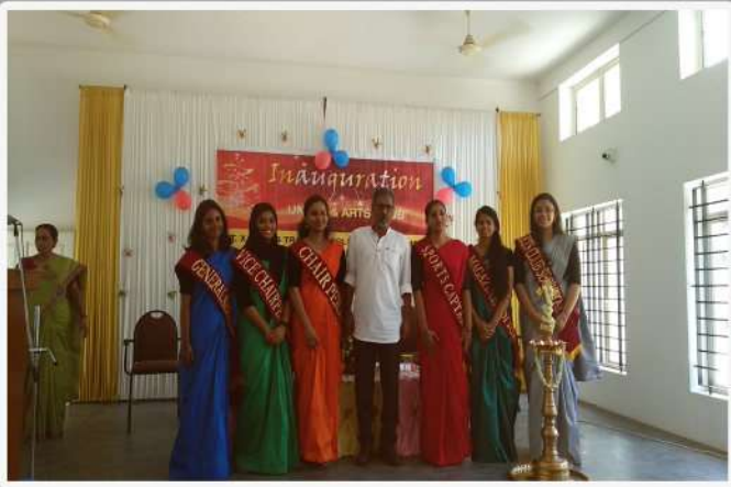
Union Members with the Chief Guest