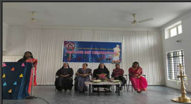
General Secretary presenting the Union Report 2018-2020