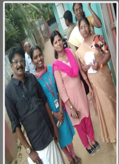
Flood Survey -2018 with Government Representatives