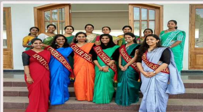
Union Members with the Staff