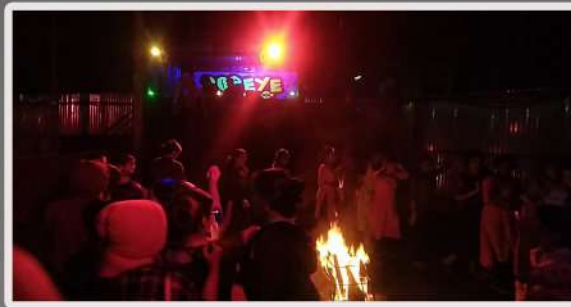
Camp Fire at Coorg