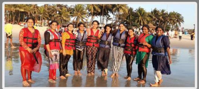
Banana ride at Malpe Beach, Uduppi