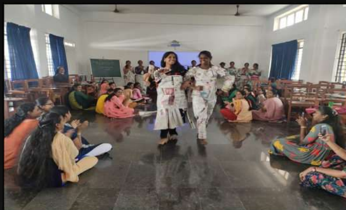
'Paper Bride & Groom' Competition