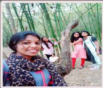
Bamboo Forest, Nisargadhama