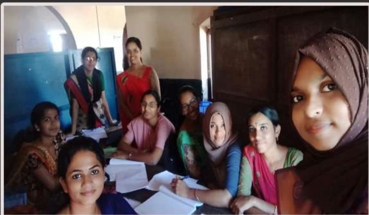
Interns at St. Francis High School for Girls, Aluva