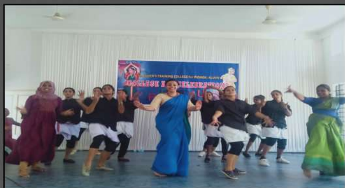
Cultural Performances by the students of Batch 2018-2020