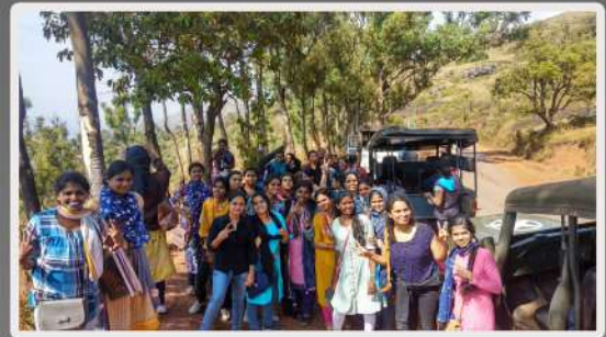
Offroad Jeep Safari at Chickmanglur