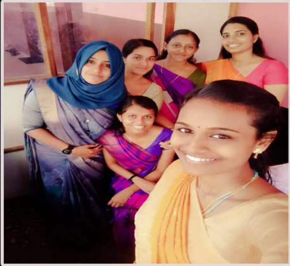
Interns at Little Flower High School, Panayikulam