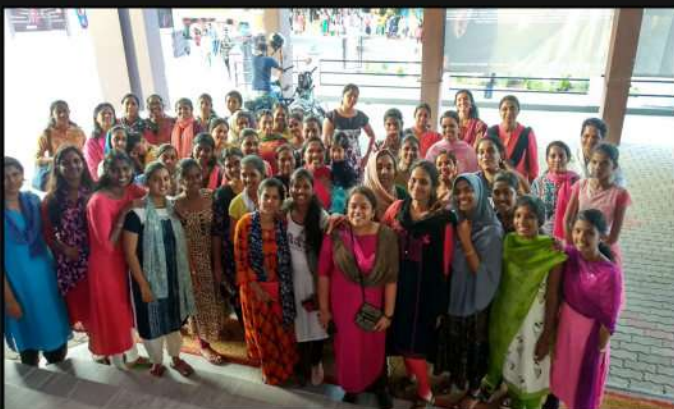
At Madha-Madhurya Theatre, Aluva