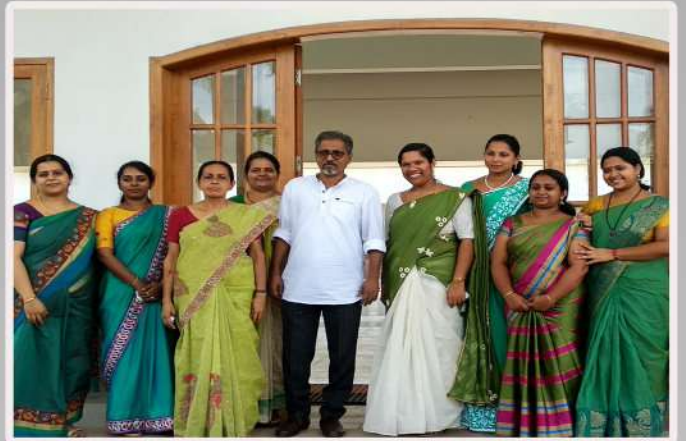
Staff with the Chief Guest