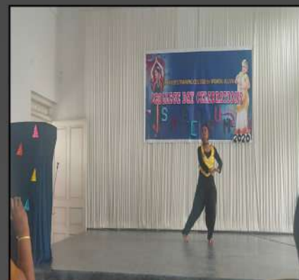
Chief Guest's Inaugural Performance