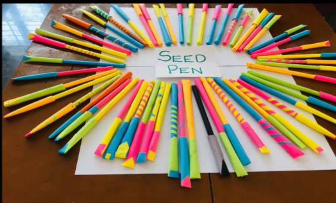
Paper seed pens made by the students and staff