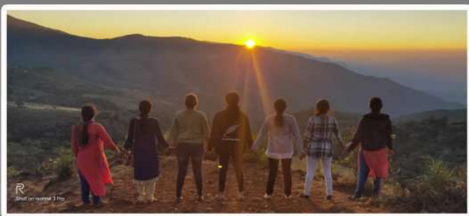
On the hills of Chickmanglur