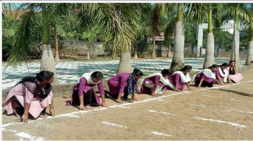
200 ms Race