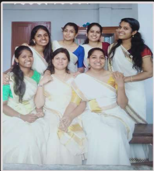
Interns at CKCHS, Ponnurunni