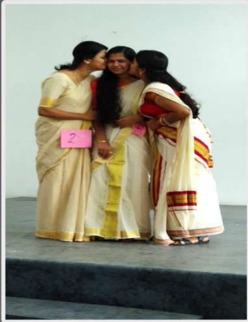
Malayali Manga Competition