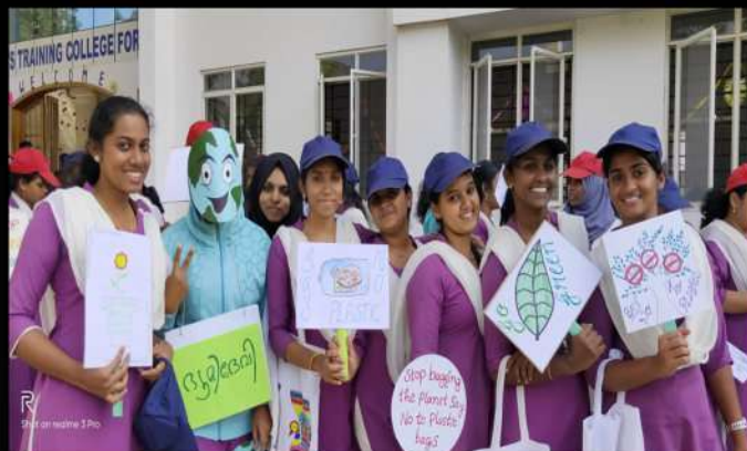
Padayathra : 'Say no to Plastic'