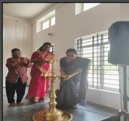
Principal lighting the lamp