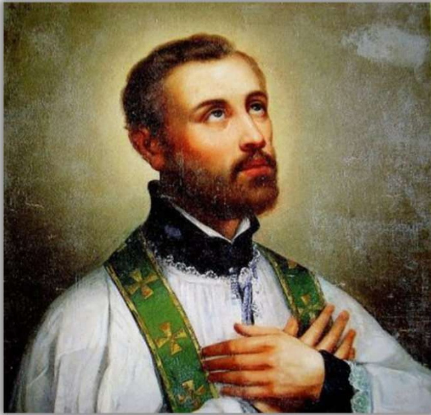
St. Francis Xavier (1506 - 1552)

“Would to God that these men who labor so much in gaining knowledge would give as much thought to the account they must one day give to God of the use they have made of their learning and of the talents entrusted to them.”