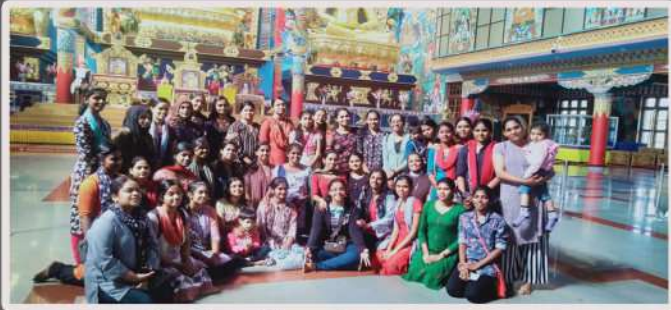
Golden Temple, Coorg