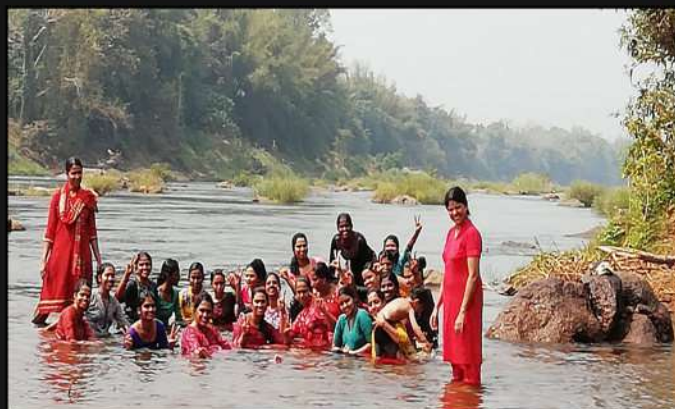
Field trip to Illithod, Malayattoor